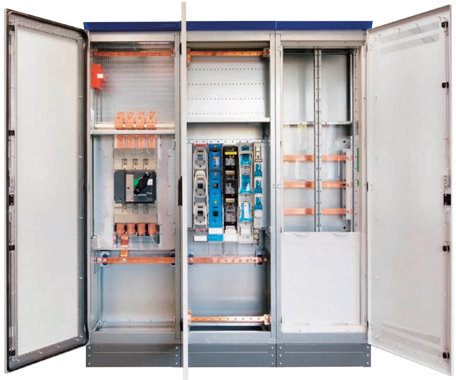
Bild 1 | Sedotec präsentiert sein neues modulares Kit-System für Niederspannungsschaltanlagen von 630 bis 1.250 Ampere. Darin hat das Unternehmen unter den Aspekten Klimaschutz, Energieeinsparung, Nachhaltigkeit und CO 2 -Vermeidung zahlreiche Innovationen realisiert.

Klimaschutz, Energieeinsparung, Nachhaltigkeit und CO 2 -Vermeidung sind keine Trendthemen, die irgendwann wieder verschwinden. Sie werden unser Handeln dauerhaft und immer stärker prägen. Davon sind keine Branche, kein Unternehmen und kein Produkt ausgenommen. Sind dabei Energieerzeugung und Energieverbrauch naheliegende Bereiche, hat an die Energieverteilung kaum jemand gedacht. Dass Energieeinsparung und Nachhaltigkeit samt CO 2 -Reduzierung auch dort gehen, zeigt der Mittelständler Sedotec mit einem neuen Produkt. Dafür haben die Verantwortlichen um die Ecke gedacht.